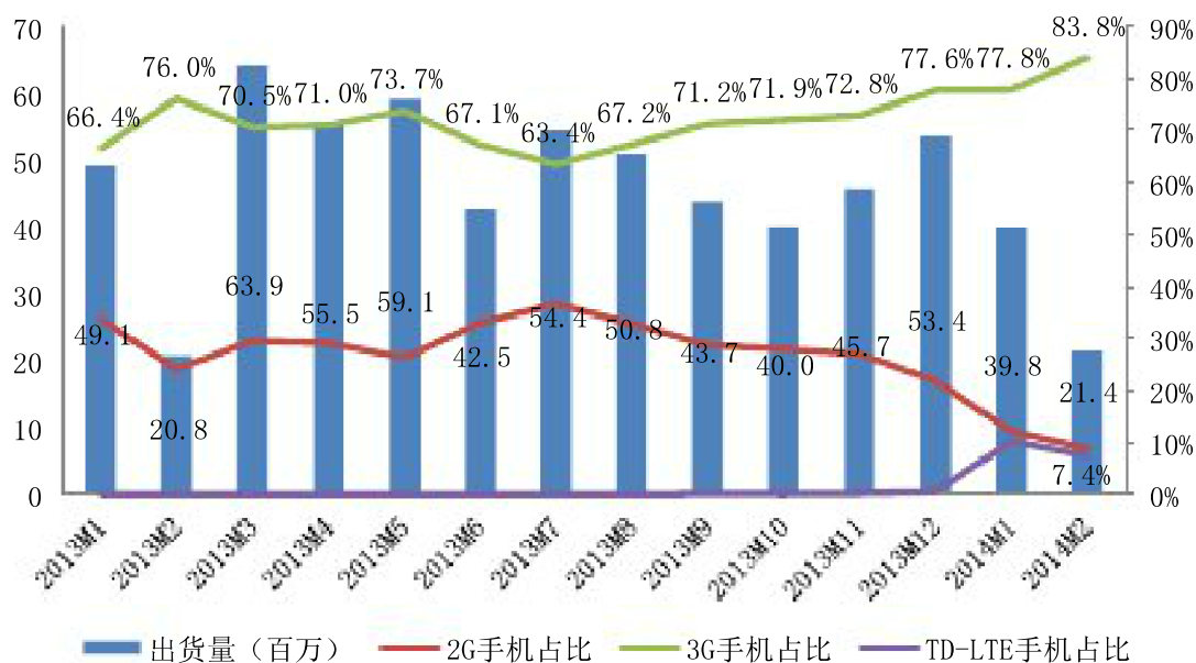
图1：2013年1月至2014年2月国内手机出货量情况

2014年1-2月，全国手机市场累积出货量为6128.1万部，同比下降12.3%。其中，2G手机出货量为669.5万部，3G手机出货量达到4894.1万部，TD-LTE手机出货量564.4万部。