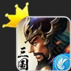
万万没想到之大皇帝